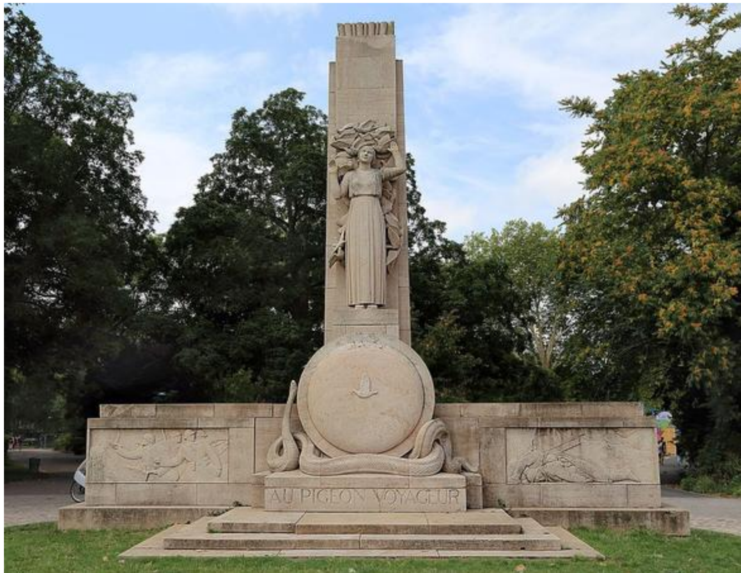
Monument «au pigeon voyageur», construit à Lille en 1936.