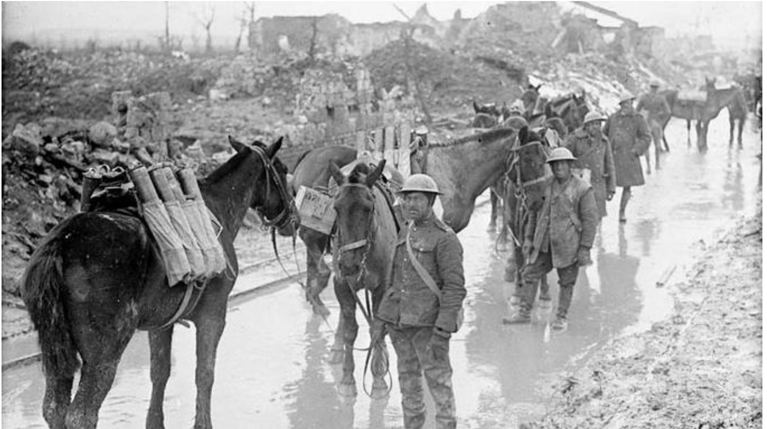
Des chevaux transportent des munitions de soldats canadiens en France en avril 1917.

À l'initiative de ce projet, l'association Paris Animaux Zoopolis s'est réjouie de cette décision. Un groupe de travail va être formé pour déterminer la forme et le lieu que pourrait prendre cette stèle commémorative.